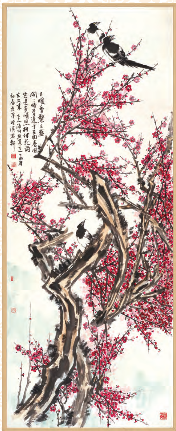
李世平 / 国画花鸟《暖阳香繁已盛开》