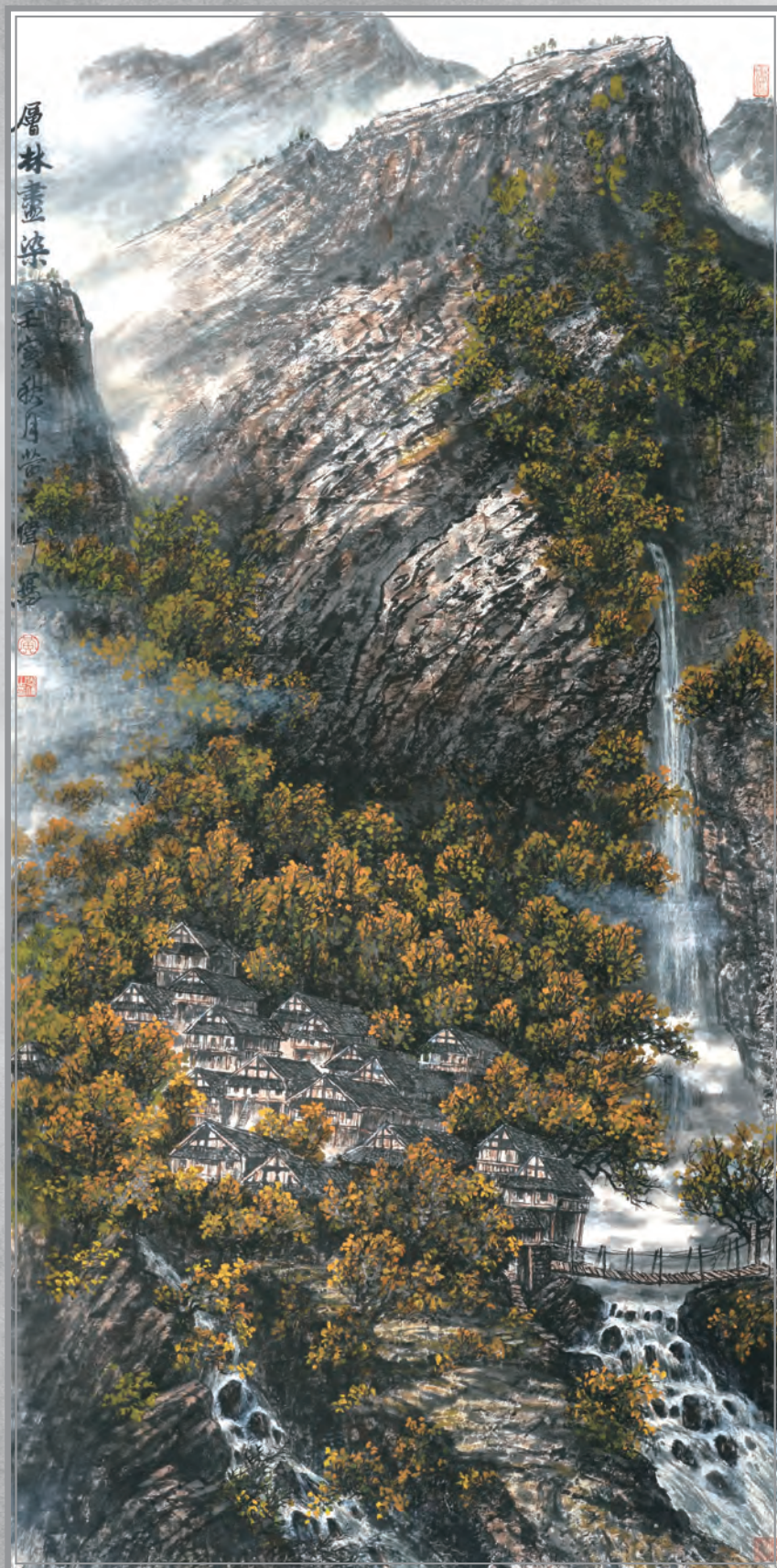
黄志伟 / 国画《层林尽染》