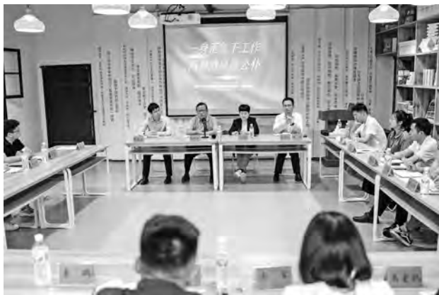
▲举行“到清溪来读书”活动

以读书为载体，广泛联谊交友，宣传益阳、推介益阳，助力文旅事业发展。 民盟益阳市委还把读书活动作为对外交流、引流入益的重要环节，引导省内外盟组织到清溪村开展“共读经典、书香润盟”暨“到清溪来读书”活动，以此向各地盟组织推介益阳。民盟中央原副主席、中国文联原副主席、中国作协原副主席、茅盾文学奖得主、著名作家张平来益阳举行新书《换届》分享会，民盟益阳市委主委班子、骨干盟员、益阳民盟文学社部分社员等参加活动，张平先生就益阳民盟文学社如何发挥优势主推益阳文旅高质量发展与盟员们亲切交流。8月，《人世间》作者、茅盾文学奖得主、当代著名作家、原民盟中央常委梁晓声来益开启“文约清溪·传承有声”活动，益阳民盟文学社应邀参加活动，梁晓声先生与主委邓曙光、社长王芳等面对面交流，盟员们还有幸