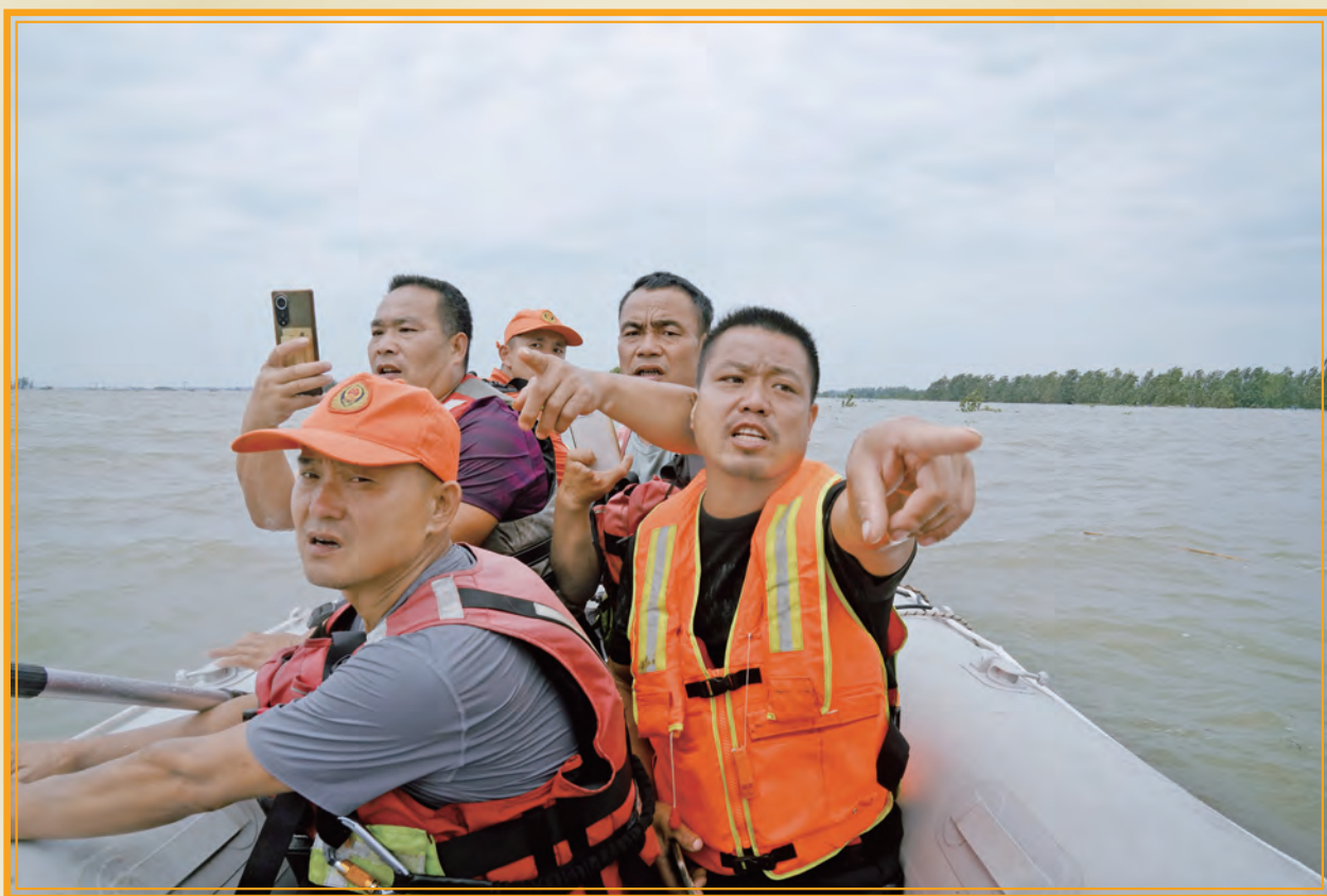
《冲入一线》