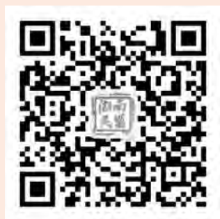
湖南民盟微信二维码