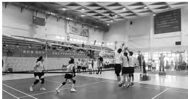
▲组织开展气排球比赛

赛事，吸引近千名盟员参与，组织向心力明显提升。发挥书画院文化阵地作用，每年举办主题创作、采风考察等“文化+”活动，以艺术形式展现履职成果，推动思想引领与文化建设深度融合，有效增强基层组织活力和凝聚力。