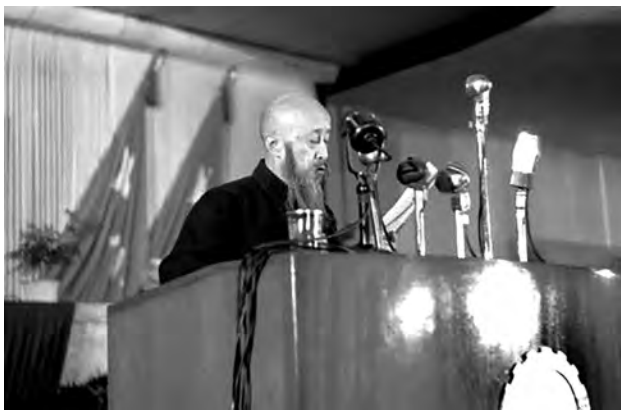
▲1949年9月24日，沈钧儒作为民盟代表在中国人民政治协商会议第一届全体会议上发言

筹备期间，沈钧儒同时主持着民盟总部临时工作委员会和中国人民救国会临时工作委员会的工作。1949年7月25日，在人救会临时工作委员会的会议上，他报告了民主人士生活待遇过于丰厚，提议要求降低生活待遇。