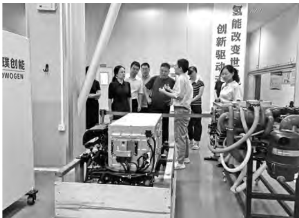
▲调研现代高端装备制造业

一是时刻关注党委政府关注点。在省市两会、经济工作会等重要会议以及重点工作中,找准省委省政府、市委市政府关注的点,然后进行针对性的调查研究,建言献策。比如去年《紧盯未来产业,加快推进“氢”新湖南建设的建议》等3件参事课题获省委、省政府高度重视。市委主要领导对岳阳的产业高质量发展非常关注,我们就通过深入的调研,在全市两会提出了《关于加快培育新质生产力助推现代石化产业高质量发展的提案》,被确定为1号重点提案。