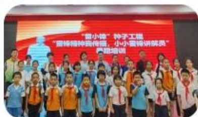
“党的故事我来讲——争做红领巾讲解员”培训实践活动