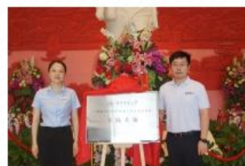
7月5日，与湖南师范大学外国语学院 签订共建协议