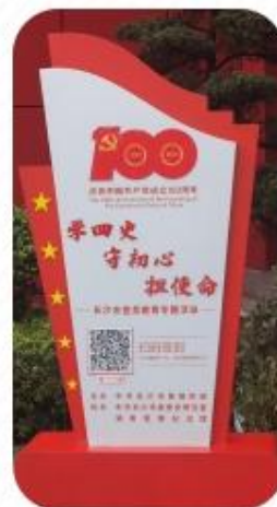
长沙市党员教育“学史打卡”专题活动

二是用好雷锋阵地，提升雷锋精神覆盖面。2021年，我馆先后主办、承办、协办“学习雷锋好榜样”中国文联文艺志愿服务活动、《榜样颂歌》首发式暨诗颂雷锋活动、“像雷锋那样当兵”、“信之风”征信宣传志愿服务活动等大中型学雷锋活动12场次；“3·5”“清明”“8·15”“9·13”等重要节点，常态化推出向雷锋同志敬献花篮等群众性线上