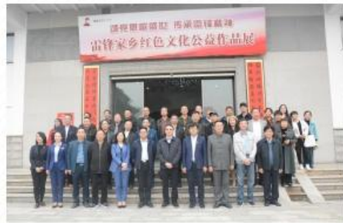
“像雷锋那样跟党走”雷锋藏品专题展