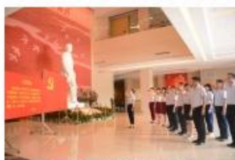
重温一次入党誓词