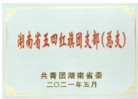
纪念馆团支部荣获“湖南省五四红旗团支部”

三是强化精细化管理，抓实干部队伍建设。重新修订《雷锋纪念馆规章制度汇编》，明确了各岗位职责及接待服务各岗位工作标准和 workflows，完善出台《宣讲员绩效考核实施细则》、《宣讲员薪酬管理办法》和《宣讲员星级评定办法（试行）》，为馆区精细化管理提供制度遵循。今年，纪念馆团支部荣获“湖南省五四红旗团支部”，游客服务中心获评“望城区学雷锋十佳优秀集体”。馆内先进典型层出不穷，先后涌现“市优秀共产党员”1名、“市离退休干部优秀共产党员”1名；“爱岗敬业”身边好人2名，优秀基层宣讲员2名；通过组织推荐和考察，推选市党代表、区党代表、区人大代表和区政协委员各1名；多名宣讲员在市区导游大赛、演讲比赛中取得优异成绩。