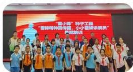
“雷小锋”种子工程社会实践活动

学校、社区，将“雷小锋”种子工程志愿服务“送上门”，雷锋馆人志愿“红马甲”频繁亮相。今年，我馆正兴学雷锋志愿服务中心获评湖南省“最佳文明实践志愿服务组织”，正由省文办、省志工办推荐参评2021年度全国学雷锋志愿服务“最佳志愿服务组织”。“雷小锋种子工程”入围湖南省2021年志愿服务项目孵化行动，《长沙伢子雷小锋》公益广告作品荣获2021年湖南省公益广告大赛专业组平面类二等奖，学雷锋志愿服务品牌持续擦亮。