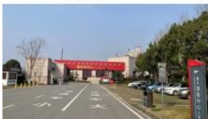
无人值守停车场建设