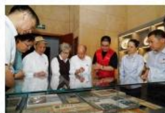
参观一次主题展览