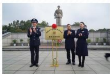
3月2日，与湖南出入境边防检查总站 签订共建协议

线下学雷锋实践活动，不断增强活动的参与感与仪式感。先后与湖南出入境边防检查总站、中国人民解放军 91526 部队、中国移动湖南分公司、湖南师范大学外国语学院等 11 家单位建立共建合作关系，雷锋纪念馆“朋友圈”不断扩大。一年来，人民日报、经济日报、央广网、光明网、学习强国、湖南日报等主流媒体聚集报道 30 多次，尽管受疫情影响，今年仍接待国内外观众 200 万人次，为观众免费讲解 19819 批次，当代雷锋郭明义、庄仕华，全国道德模范刘习明，省领导毛伟明、乌兰、吴桂英、南小冈等先后来馆参观。