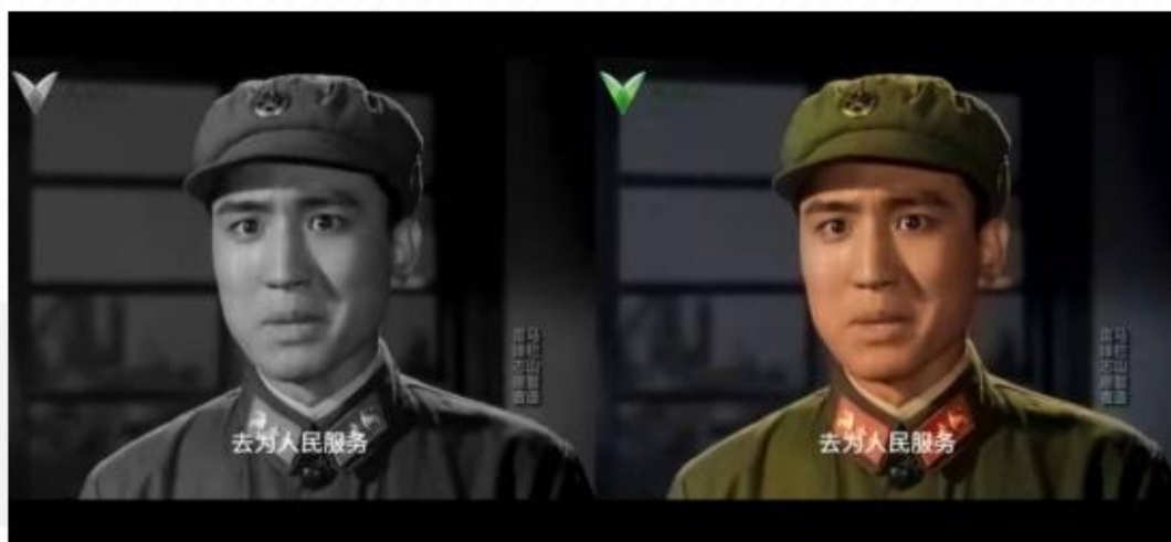
电影《雷锋》从黑白到彩色数字修复