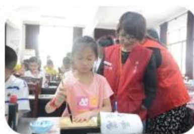
“扶志助学”书画培训班