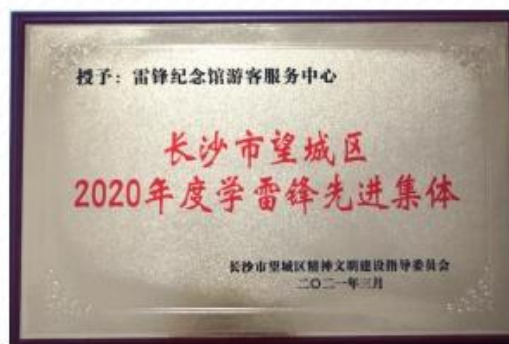
游客服务中心获评“望城区学雷锋十佳优秀集体”