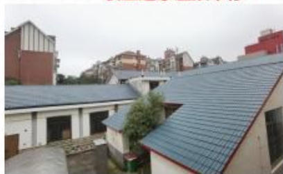
职工之家屋顶维修