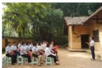
走进一次雷锋故居