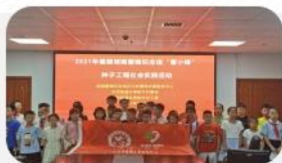
“雷小锋”种子工程进社区