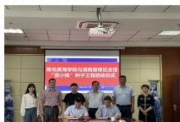
6月17日，与青岛黄海学院 签订共建协议