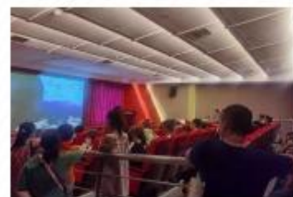
观看一场雷锋电影