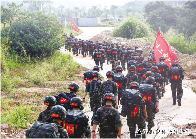
▲深山密林长途行军