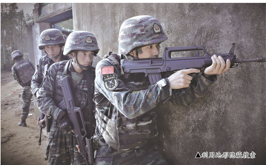
▲利用地形隐蔽搜索