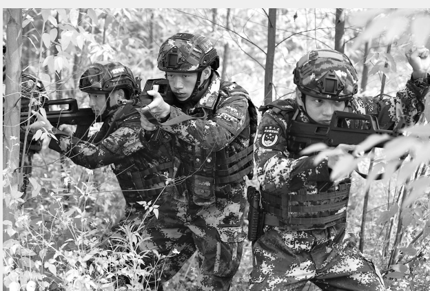
9月18日，武警广西总队来宾支队组织特战队员进行强化训练。