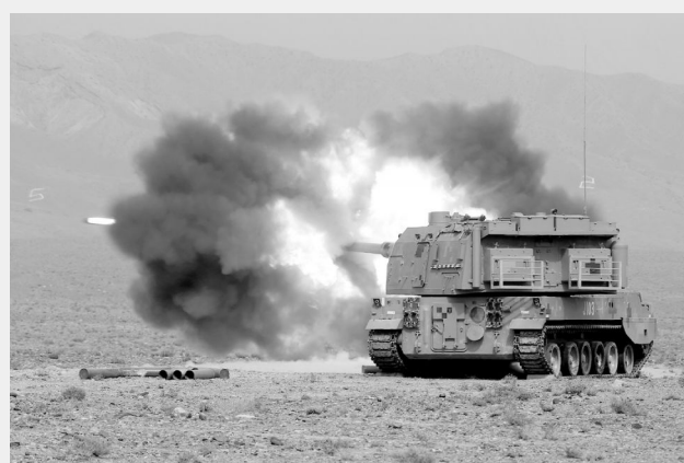
近日，喀喇昆仑山下新疆军区某炮兵团一场实装实弹演练在大漠风沙中展开。