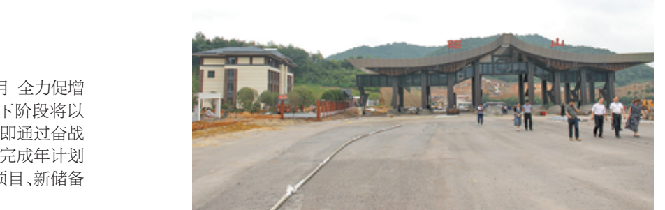
京港澳高速昭山北互通收费站像一个舒展的翅膀。

“作为产业园区,要始终把项目建设作为重中之重来抓,大干、实干、巧干、苦干,奋战五个月,全力促增长”昭山示范区党工委书记秋兴要求各部门(单位)按时间节点倒排工期,全力以赴推动重点项目建设。他说,“项目快不快,关键在干部,关键在落实”,要充分发挥党员干部的先锋模范作用,以“两学”长才干,以“一做”立标杆,要由点到面,全面把握项目建设的进展态势,咬定目标不动摇,凝心聚力抓落实,努力开创项目建设新局面;要由表及里,转变观念、勇于创新,清醒找准项目建设的瓶颈制约,切实增强责任感和时不我待的紧迫感,着力攻破项目难题;要由上至下,自觉担当项目建设的主力军,使出冲劲、增强后劲、锤炼韧劲,以更强的支撑、更好的作风、更快的速度推动项目进展,确保圆满完成全年重点项目建设任务。