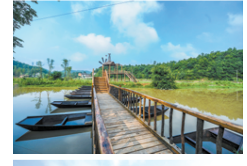
昭山城市海水上乐园正加紧道路硬化。