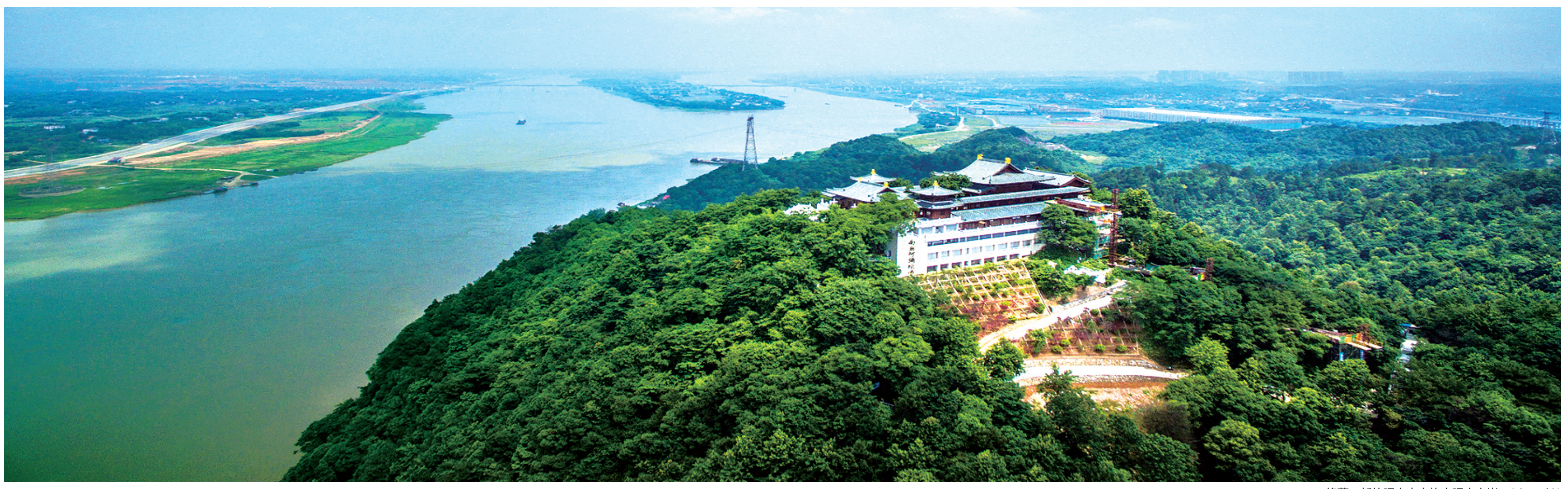
修葺一新的昭山古寺屹立昭山之巅。