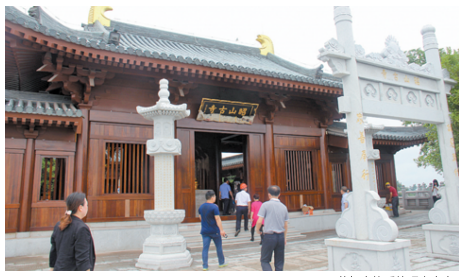
落架大修后的昭山古寺。