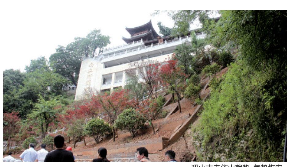
昭山古寺依山就势,气势恢宏。