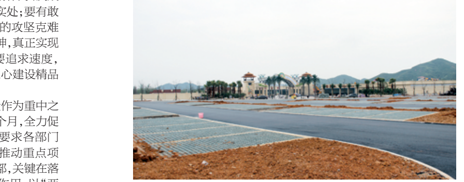
昭山城市海水上乐园外,生态停车场主体完工,正加紧绿化。