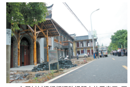
七星村村级组织活动场所主体已完工,正加快内外装修。

奋战五个月,蓄足后劲是有效保证。有了项目的蹄不停蹄,才有发展的持续向前。因此,既要加紧眼前的项目建设,也要对后续项目的引进和落地。有计划、有针对性地引进、包装、储备一批重大项目,是增强发展后劲,实现新一轮加速发展的必然路径。对已签约未启动的项目,要压实责任,明确专人跟踪服务,加大对接力度,确保项目落地、启动建设。要营造良好的投资环境,抓住投资所需,更直接、更高层次地开展招商引资,为昭山发展注入新动力,增添新活力。