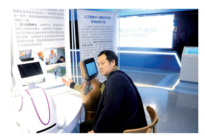
湖南智超医疗科技有限公司打造的智能医疗机器人亮相湖南健康产业园规划展示馆。