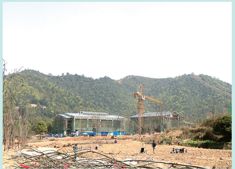
途居昭山国际房车露营地项目快速推进。