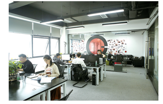
湖南华壹影业有限公司签约入驻湘潭昭山文化产业园。