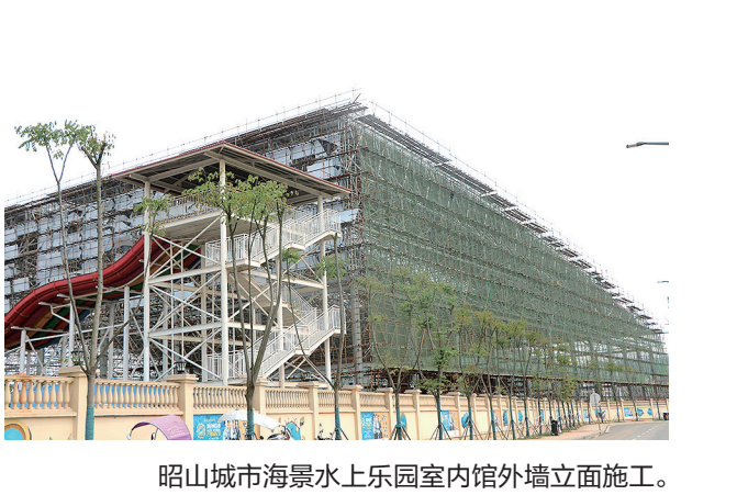
昭山城市海景观水乐园室内馆外墙立面施工。