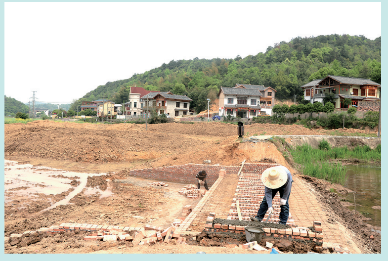
七星楼悦田园项目立新渠沿岸土地平整完成,正在进行拦河坝等景观建设。

“我们要把责任举过头顶,把承诺扛在肩上!”该区党工委书记成秋兴说,昭山必须将沉甸甸的责任化为一项项推动项目建设的具体行动,努力使响当当的承诺结出发展硕果,让“四责四诺”入脑入心、见行见效,让党的十九大大精神在“绿心”落地生根、开花结果。