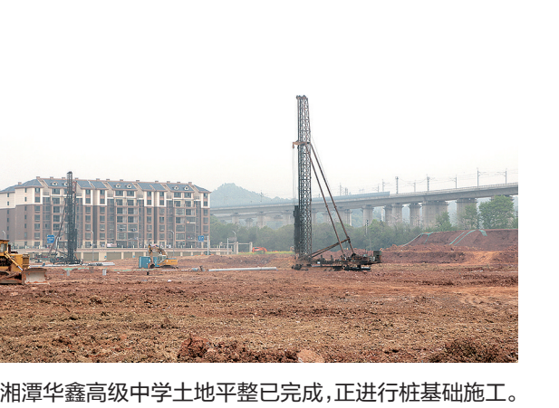
湘潭华鑫高级中学土地平整已完成,正在进行桩基施工。