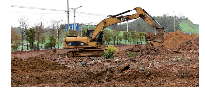
湖南健康产业园医学医药创新中心加快施工。

湖南健康产业园医学医药创新中心、湖南惠景生殖与遗传专科医院、湘潭恒大·养生谷、昭山城市海景观水乐园(二期)、途居昭山国际房车露营地、七星楼悦田园、湘潭华鑫高级中学……一大批产业项目正加快推进,让长株潭市群的生态“绿心”——昭山示范区焕发勃勃生机。