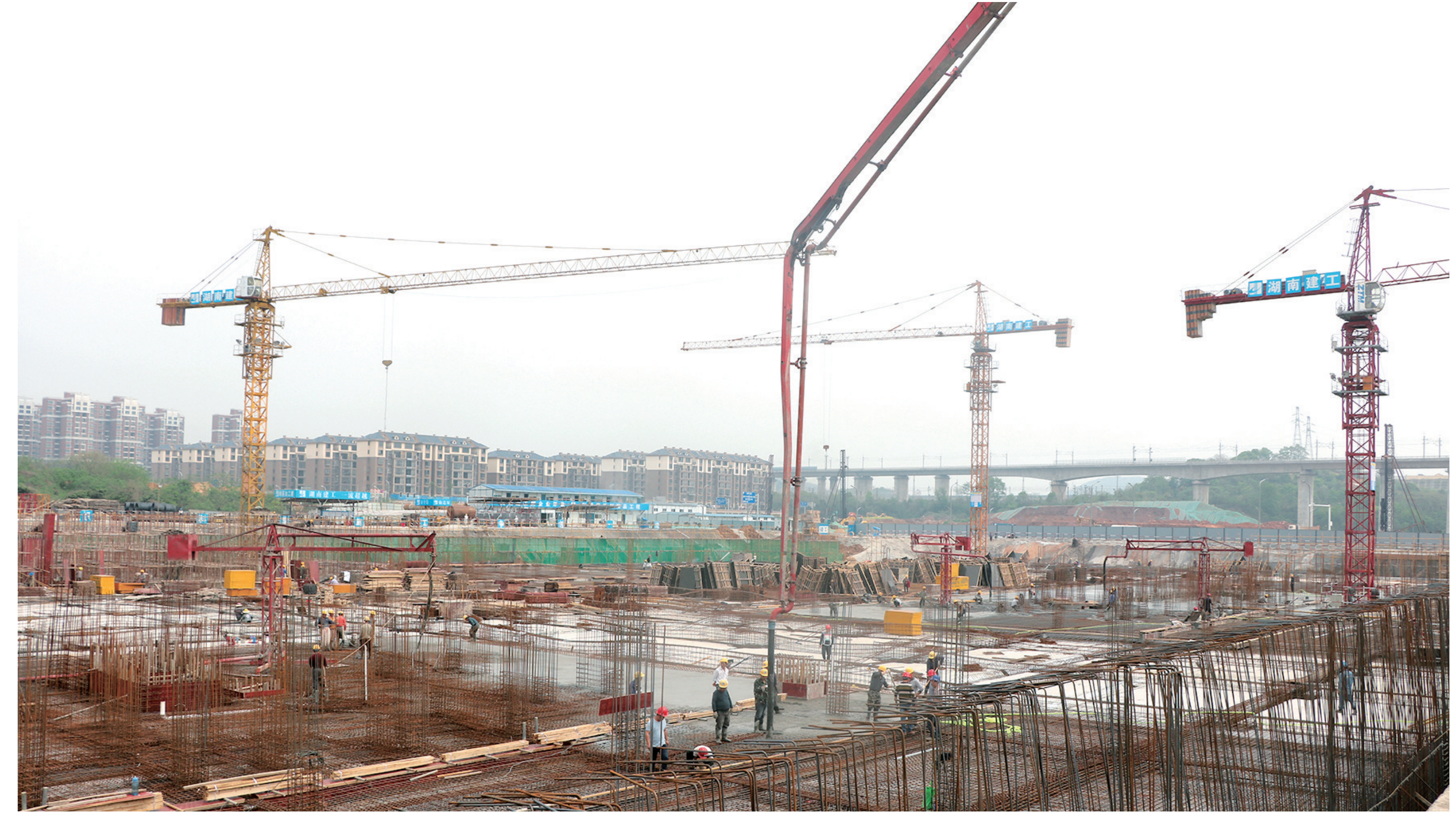
昭山棚户区改造集中安置小区(二期)浇筑地下室底板。